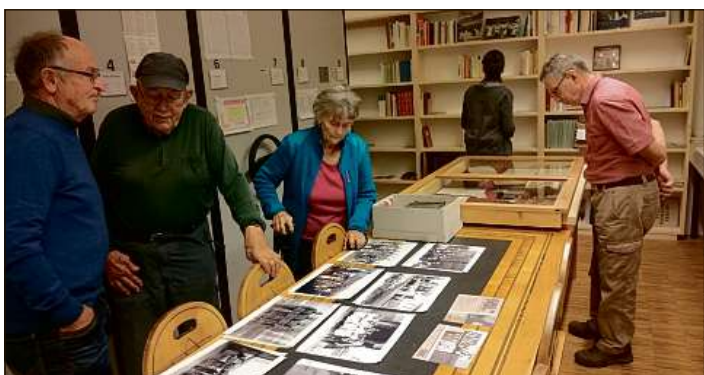
Era gliued da Laax e da Falera ha giu interess digl archiv niev ad Uors. Quel dalla Foppa ei a Rueun.