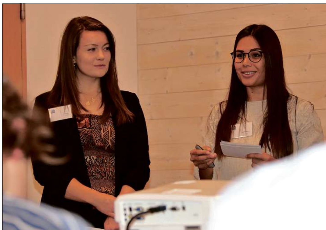
Studentas e students dalla Scol'aula per scienzias applicadas Turitg a Wädenswil han presentau ils quater projects che duein ussa vegnir realisai sut il tgamun da gruppas da lavur cun personas indigenas.

Ina pertucca las vias da velo, l'atra ina nova via cun pumera ed in'ulteriura in festival che duei haver liug l'auter onn. In ulteriur project duei la finfinala far quels treis, mo era l'ulteriura purschida dalla Val Medel, pli econuschents. La partenza per quei project parzial numnaus «Val Medel Goes Social» ei succedida ed entochen Nadal duein emprems cuntengs esser publics. Vid igl entir process ha en special la giuventetgna dalla Val Medel collaborau. Ulteriuras personas ein allura sedecididas da separticipar allas gruppas da lavur che sorprendan uss il tgamun dils projects. Quels ein vegni elavurati comunablamain cun student(a)s dalla Scol'aula per scienzias applicadas Turitg a Wädenswil. Il gliendisdis ei quei process da cooperaziun vegnius terminaus suenter ina lavur da rodund in onn e miez. Sco